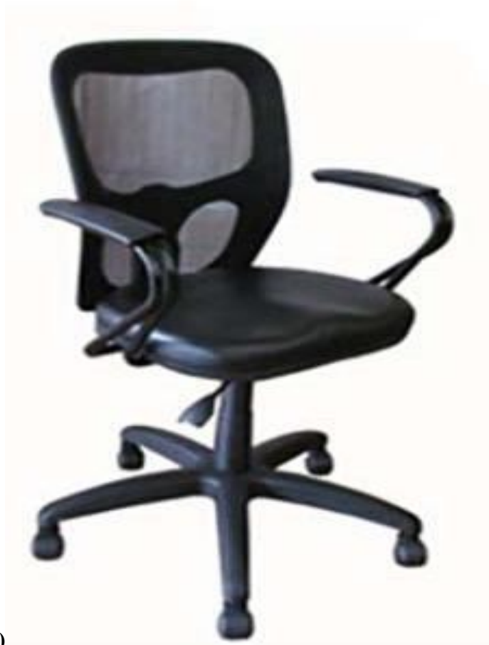
7- SNAA (imagen tipo)

Poder Judicial de la Provincia de Santa Fe