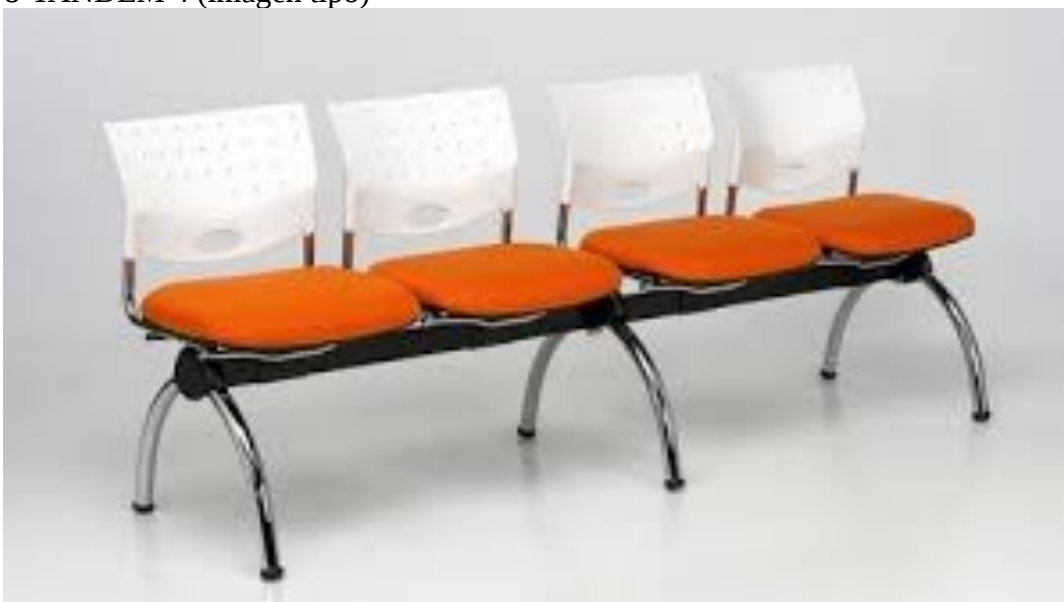
8-TANDEM 4 (imagen tipo)

Sede Central La Rioja 2633 3000 – Santa Fe