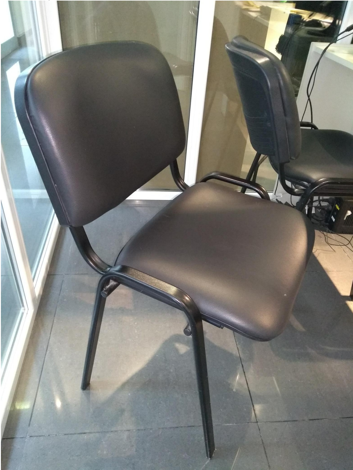
SF: Silla Fija ecocuero